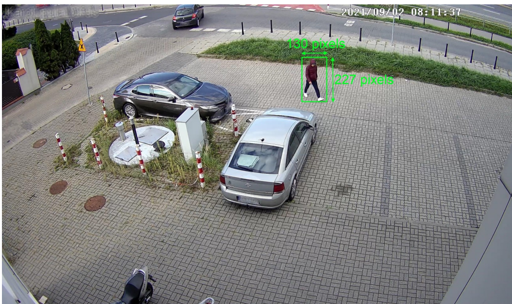
Image resolution: 2592 x 1520 Minimum object size: 4% of 2592 (width) and 8% of 2592 (height) Width: 130 pixels = (130/2592)*100 = 5\% - correct object size Height: 227 pixels = (227/2592)*100 = 8.7\% - correct object size

Image resolution: 2592 x 1520 Minimum object size: 4% of 2592 (width) and 8% of 2592 (height) Width: 83 pixels = (83/2592)*100 = 3.2\% - object is too small Height: 167 pixels = (167/2592)*100 = 6.4\% - object is too small