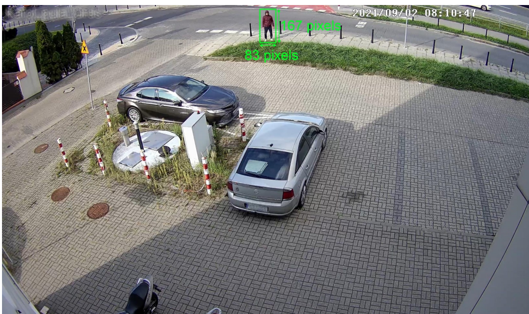
Image resolution: 2592 x 1520 Minimum object size: 4% of 2592 (width) and 8% of 2592 (height) Width: 83 pixels = (83/2592)*100 = 3.2\% - object is too small Height: 167 pixels = (167/2592)*100 = 6.4\% - object is too small